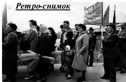
Лет 15 назад на первомайскую демонстрацию ходили коллективами.