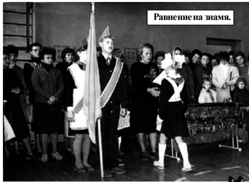
Равнение на знамя.

онерская комната. И поэтому так бесценно для истории школы то немногое, что чудом сохранилось до наших дней.