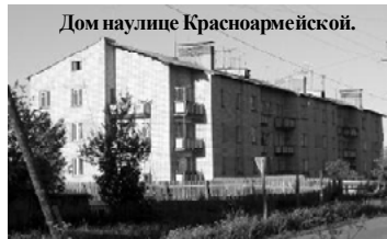
Дом на улице Красноармейской.

НЕ ЗНАЮ, может время подсказывало поназыревцам, как назвать ту или иную улицу, но с патриотизмом в этом деле было все в порядке. Что ни улица, то звучное название: Советская, Партизанская,