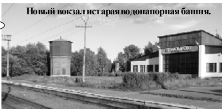
Новый вокзал истарая водонапорная башня.

Торговля на перроне прекратилась, как только в Поназыреве построили крытый рынок - это в районе нынешней гостиницы.