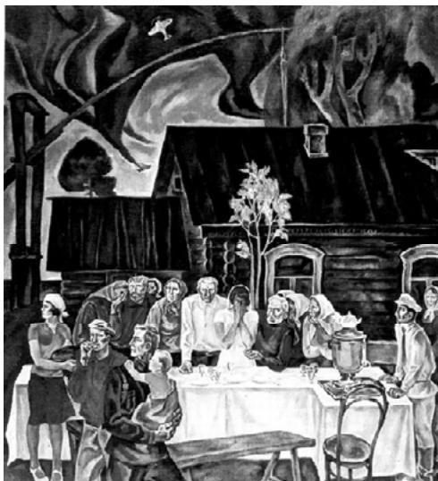
Худ. Ю.А. Дорофеев. «22 июня 1941 года», 1981.