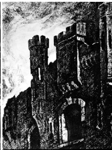
Худ. П.С. Дурчин. «Башня Холмских ворот». Из серии «Брестская крепость-герой». 1970.