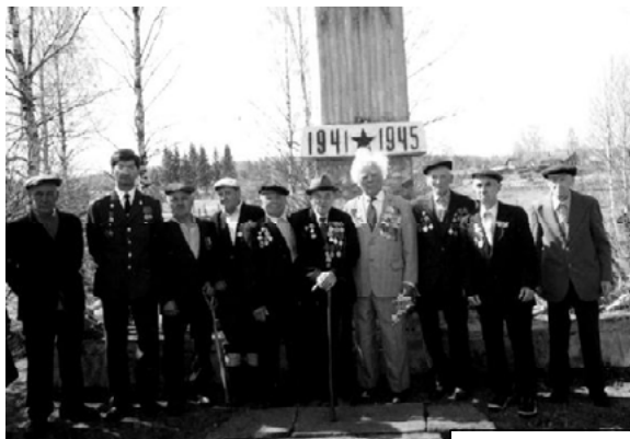
9 Мая 2005 года у памятника в пос. Подневеша.