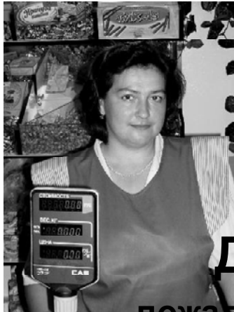
продавцы ОАО «Поназыревское».

Желаем радости, весны, цветенья, Здоровья, бодрости настроенья. И счастья светлого, всегда маящего, Пусть даже трудного, но настоящего.