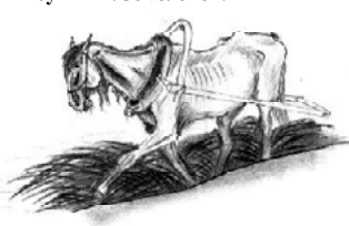
Рисунки А. Соколовой.