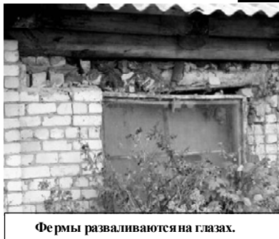
Фермы разваливаются на глазах.