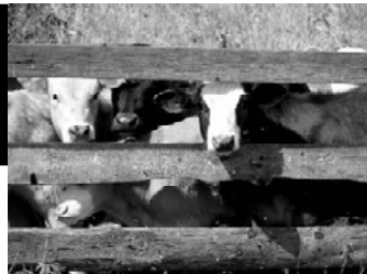
Все меньше буренок на селе.

С введением рыночной экономики наши совхозы преобразовались в СПК. Кажется, все стали хозяевами земли и средств производства: работы, созидай, корми себя и народ. Руководство практически не сменилось. Директора стали председателями, те же специалисты в конторах на полях и фермах. Но небольшой анализ указывает на странную повтораемость чисел, близких к цифре 3. И эта тройка становится для нашего сельского хозяйства почти роковой. По данным ЦСУ на 1 января 1990 года, было в хозяйствах посеяно 3183 га зерновых. По итогам весеннего сева этого года — 980. Посевные площади сократились в 3,25 раза. Только за последние четыре года они уменьшились на 400 гектаров (по 100 га в год!). На 1 января 2000 года было произведено зерна 5729 ц, мяса 694 ц, молока 437 тонн при среднем удое на одну корову 1345 кг. Число КРС составило 830 голов, в том числе коров — 295, у населения насчитывалась 891 корова. На эту же дату 2005 года число КРС составило всего 360 голов (сокращение в 2,3 раза), коров 132 (уменьшилось в 2,2 раза). В прошлом году было реализовано мяса в живом весе 508 центнеров (279,4 ц в убойном), что в 2,5 раза меньше на начало неофициальной пятилетки, и надоев молока 313,7 тонны. При увеличении надоев молока от коровы показатели по валовому его сбору упали на 123,3 тонны по отношению к 1 января 2000 года.