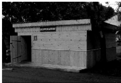
СПК «Возрождение» кормит население поселка Поназырево молоком и мясом.

Для современной деревни большим становится вопрос закрепления молодежи на селе. Многие механизаторы ушли на пенсию, другие в предпенсионном возрасте. Вчерашние пяташки не желают садиться на разваленную старую технику, стремятся покинуть родные места в надежде найти более при-