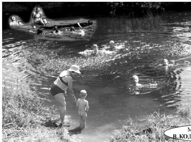
Материалы 1-й полосы подготовили В.КОДОЛОВ, И.МАНИНА и И.МЕЛЬКОВА