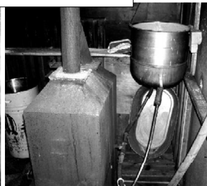
На снимках: слева - мастерская, справа - чудо-печь в бане.