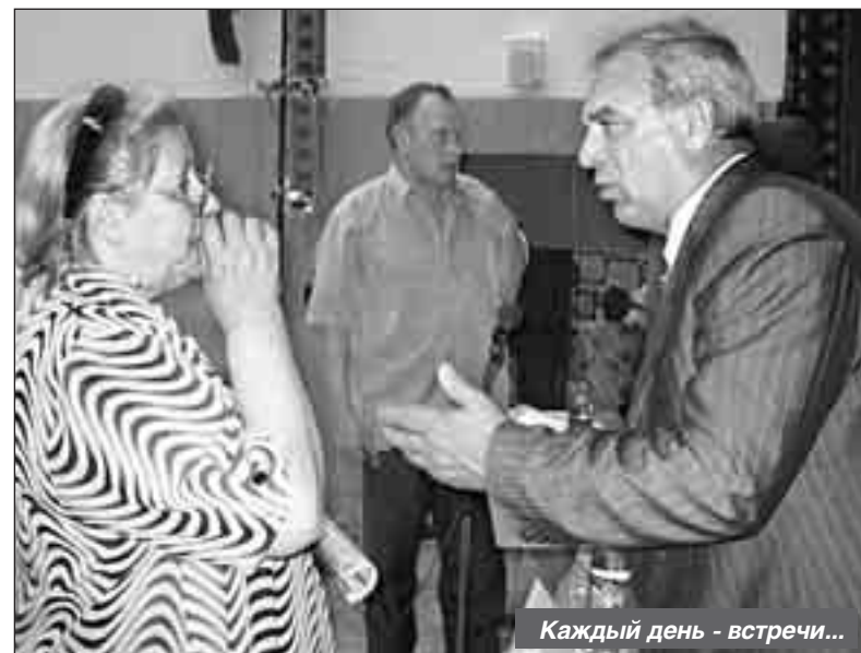
Каждый день - встречи...

Евтихию особо отмечает: то, что связано с людьми, не может находиться в режиме долголетнего ожидания. Префект говорит, что с огромным удовольствием сохранил бы право первоочередности в предоставлении квартир многодетным семьям. И он не согласен с тем, что в списке приоритетных категорий Мосгордумы они не сохранены. Сегодня Евтихию ищет пути решения и этой непростой задачи.