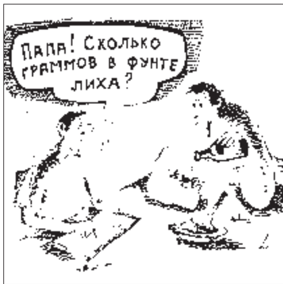
РИСУНОК АЛЕКСАНДРА ПРОХОРОВА