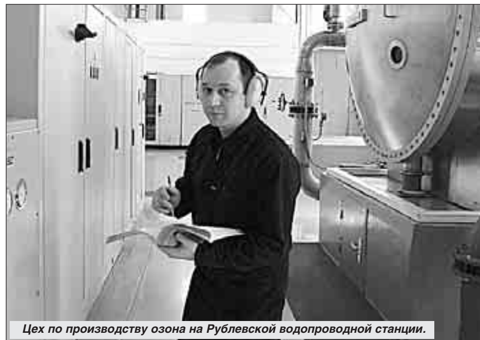
Цех по производству озона на Рублевской водопроводной станции.