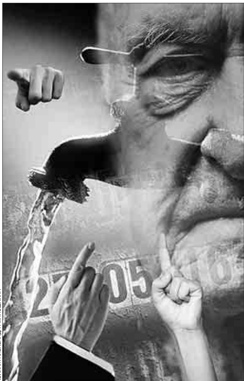
КОЛЛАЖ АЛЕКСАНДРА МАТЮШКИНА

- После нашего визита в ЕИРЦ и Горэнергобыт я написал в ЕИРЦ еще одно письмо: попросил все-таки сделать перерасчет потребленной воды. И знаете, что мне ответила зам начальника ЕИРЦ? «У вас разница всего-то 200 рублей». - «Не 200, а 400 - за два месяца», - уточнил я размер переплаты. А она: «Вам 200 рублей жалко?» Я: «Жалко, конечно. Зачем платить лишнее? Буду платить только за то, что потребил». Она: «Займите у кого-нибудь». «Я в жизни ни у кого не занимал, - ответил я. - И не хочу». «Я вам дам 200 рублей, - сказала она. - Когда