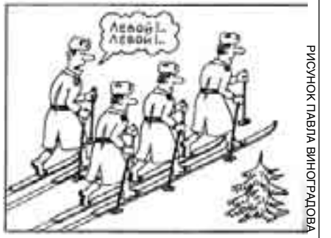
РИСУНОК ГЛАВЛА ВИНОГРАДОВА