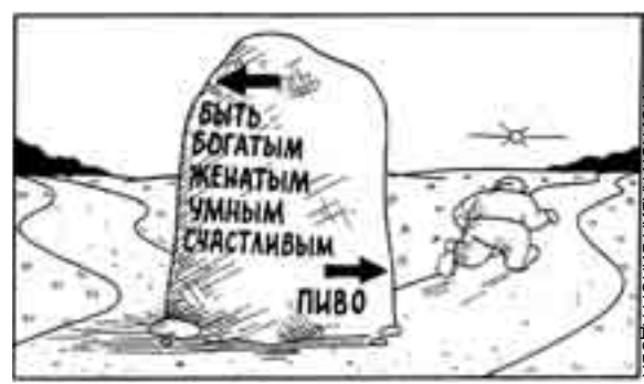
РИСУНОК ГЛАВЛА ВИНОГРАДОВА