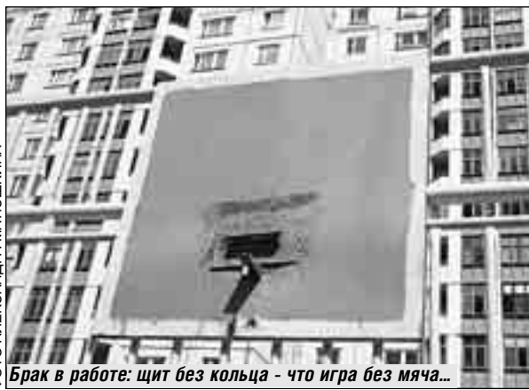
Брак в работе: щит без кольца - что игра без мяча...

Скоро пацаны подойдут, и начнем играть, - не смущаясь, отвечают ребята. - Мы не новички какие-то, а победители районных турниров. И клуб у нас хороший, «Добрыней» на-