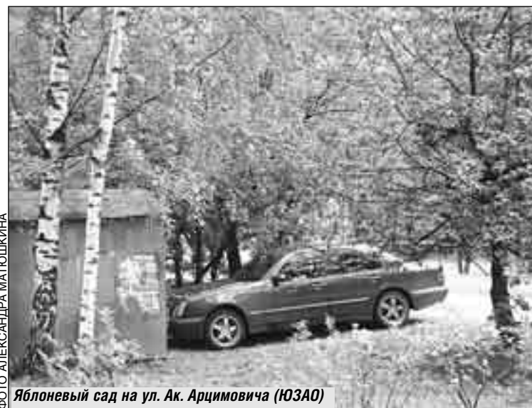
Яблоневый сад на ул. Ак. Арцимовича (ЮЗАО)

- Не только телефон! Стоит задеть кого-нибудь из серьезных коммерсантов, как начинаются депутатские запросы, звонки, встречи... Но могу вам сказать, что наша последовательная