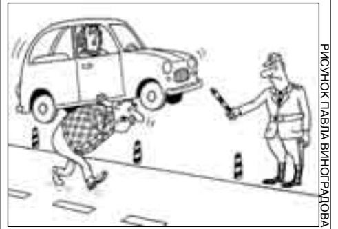
РИСУНОК ПАВЛА ВИНЮГРАДОВА