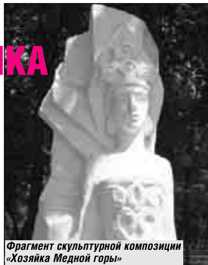
Фрагмент скульптурной композиции «Хозяйка Медной горы»