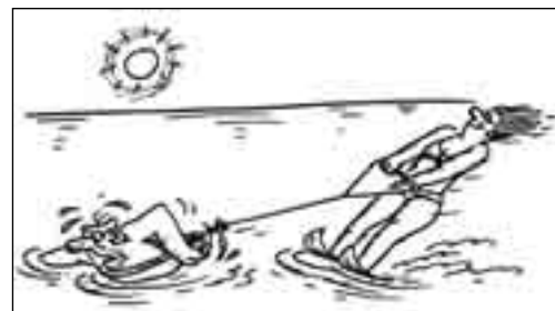
РИСУНОК ВИКТОРА ФЕДОРОВА