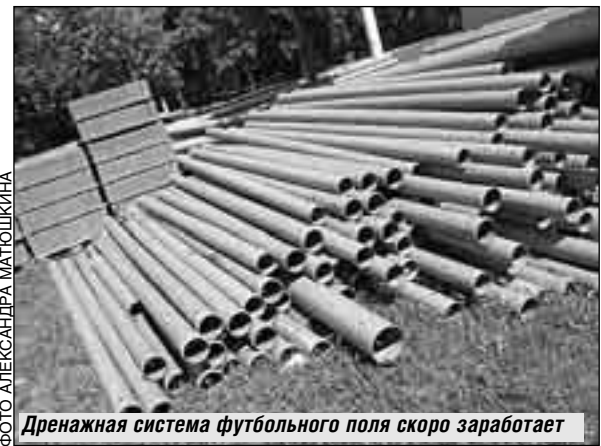
Дренажная система футбольного поля скоро заработает