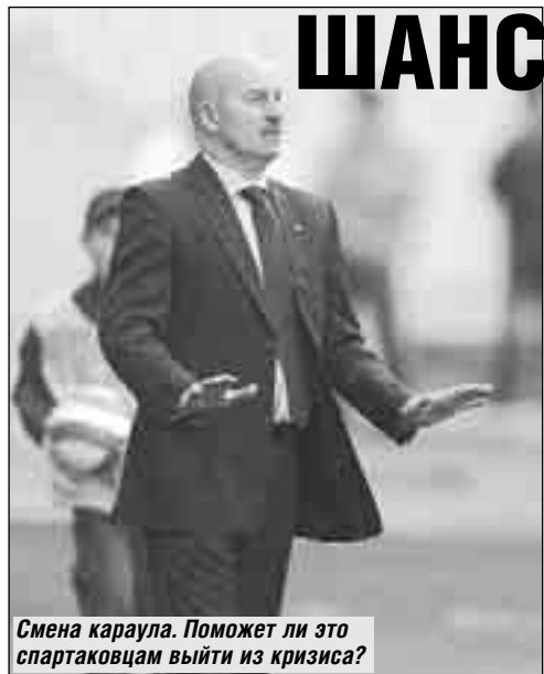
Смена караула. Поможет ли это спартаковцам выйти из кризиса?